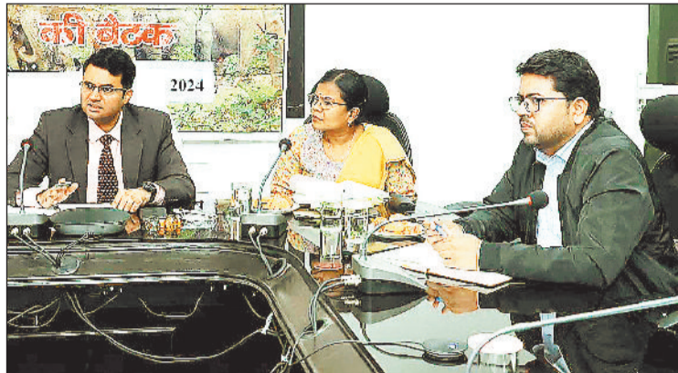
हाथी सुरक्षा समिति की बैठक में मौजूद कलेक्टर, डीएफओ व अन्य अधिकारी।