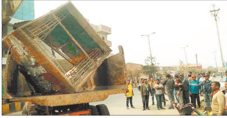
अतिक्रमण हटाते निगम कर्मियों।

शहर में एक बार फिर से नगर निगम में नो वॉइंग जोन में नियम विरुद्ध तरीके से संचालित ठेले गुमटियों के खिलाफ अभियान शुरू कर दिया है। बुधवार को ननि आयुक्त के निर्देश पर उड़न दस्ता दल की टीम द्वारा शहर के प्रतीक्षा बस स्टैंड में अभियान चलाकर गुमटियों पर कार्रवाई की गई। इस दौरान टीम द्वारा चार गुमटियों को जब्त किया गया इसके साथ ही दर्जनभर से अधिक गुमटी संचालकों को अपना नो वॉइंग जोन से अपनी गुमटियों को हटाने के निर्देश दिए हैं जिसके बाद गुमटी संचालकों में हड़कंप मचा हुआ है। बता दें कि प्रदेश में सत्ता परिवर्तन के बाद जिला प्रशासन व नगर निगम की टीम एक्टिव हो गई है और शहर में व्याप्त अव्यवस्थाओं को दूर करने