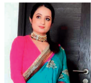
हाईलाइट हो सके। इस तरीके के स्वेटर को आप ब्लाउज के ऊपर विवर करें।

एक्सेसरीज को करें एड: इस लुक को और ज्यादा खूबसूरत बनाने के लिए साड़ी के साथ एक्सेसरीज को मिक्स मैच करें। इसके लिए (फुल स्लीव्स ब्लाउज) आप साड़ी के कलर से मैचिंग एक्सेसरीज विवर कर सकती हैं वरना आप चाहे तो कॉन्ट्रास्ट में भी ज्वेलरी विवर कर सकती हैं। इससे भी आप काफी सुंदर नजर आएंगी।